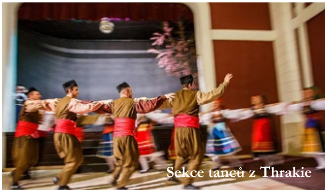
Sekce taneřů z Thrákie

Při příležitosti oslav patnáctého výročí existence si připravilo Lyceum Řekyň v České republice ve spolupráci s nadačním fondem Hellenika pro milovníky řecké kultury a tradic jedinečný zážitek - představení tradiční řecké svatby. To se uskutečnilo dne 26. 9. 2015 v hotelu Kozák v Brně.