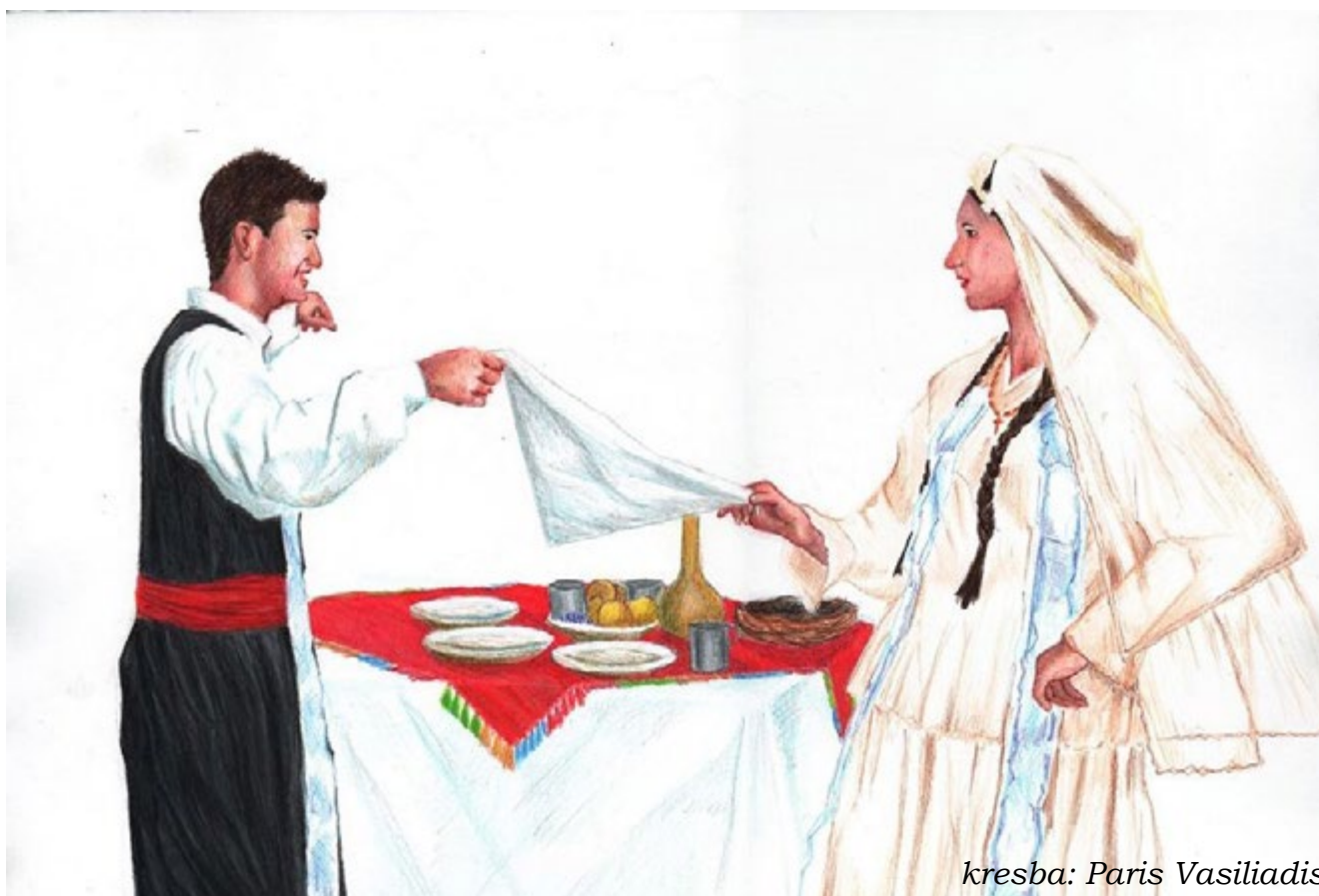
kresba: Paris Vasiliadis

Program činnosti Lycea na rok 2015, uvedený na následující straně, byl schválen valným shromážděním Lycea Řekyň v ČR dne 21. 3. 2015.